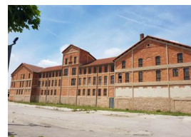
6 - 5 juin 2018, visite du Mémorial du camp des Milles. 40, chemin de la Badesse, Aix-en-Provence