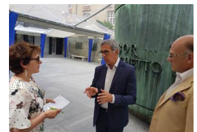
2 - 31 mai 2018, visite du Mémorial de la Shoah. 17, rue Geoffroy L'Asnier à Paris 4