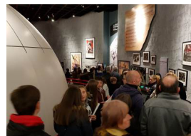
1 - 2 mai 2018, visite du Mémorial de Caen. Esplanade Général Eisenhower, Caen