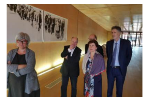
7 - 15 juin 2018, visite du Mémorial du camp de Rivesaltes. Salses-le-Château, Chemin de Tuchan, Sainte-Mairie