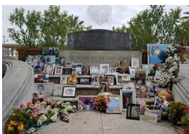
5 - 6 juin 2018, déplacements à Nice