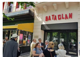
3 - 31 mai 2018, visites des lieux d'attentats à Paris.