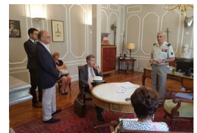
4 - 27 juin 2018, Hôtel des Invalides à Paris. 4, bd des Invalides à Paris 7